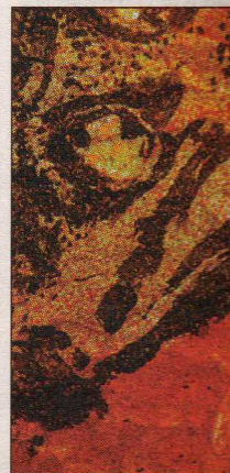
Aaltonens tavla i närheten går riktigt nära.