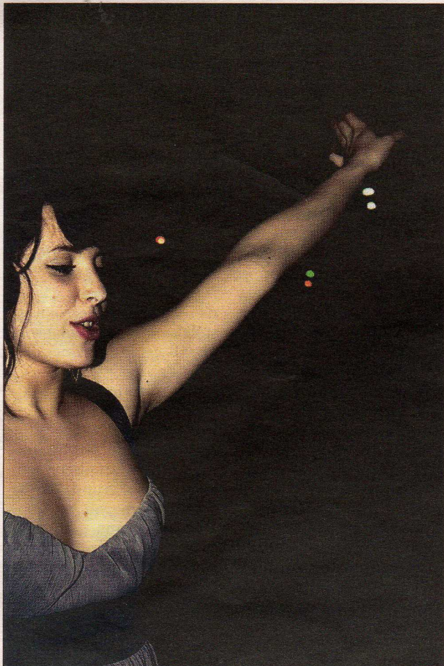
Skickligt fångade rörelser i Lina Enlunds bilder.